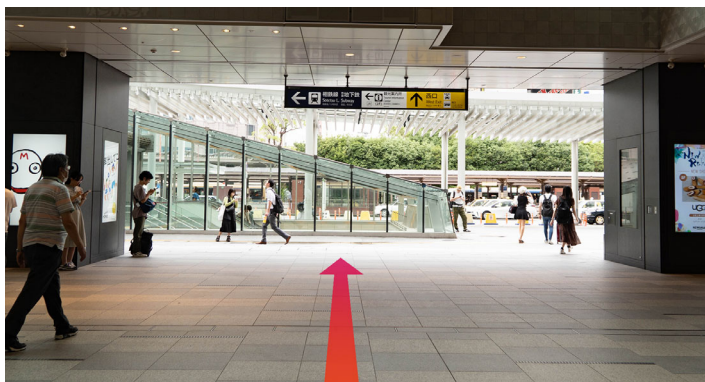
3 エスカレータを登って直進し、西口から外へ出ます。