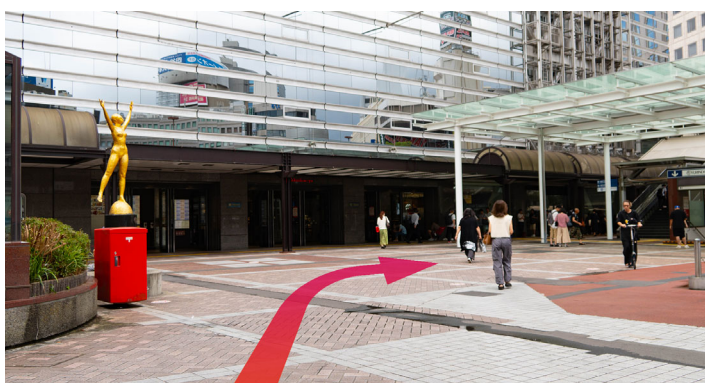
5 ポストと像がある広場を過ぎて高島屋まで進み、右に折れます。