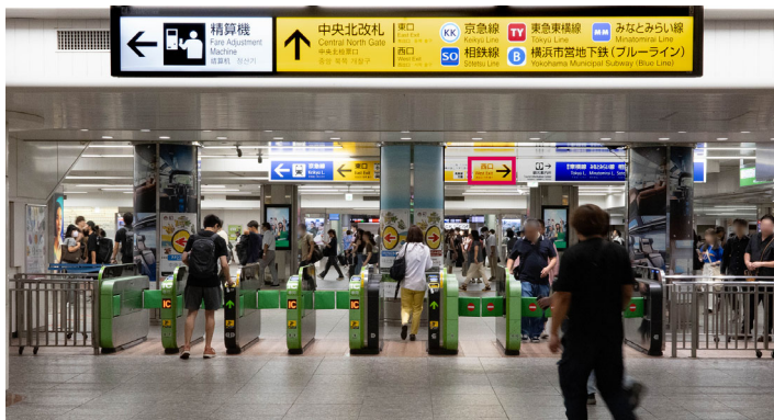
1 JR横浜駅「中央南口」または「中央北口」から出て、西口へ向かってください。 ※中央北改札から出た場合は右、中央南改札から出た場合は左に進みます。