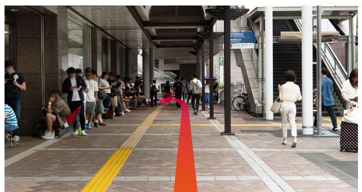
6 高島屋前を左手に、直進して突き当たりを左に折れます。