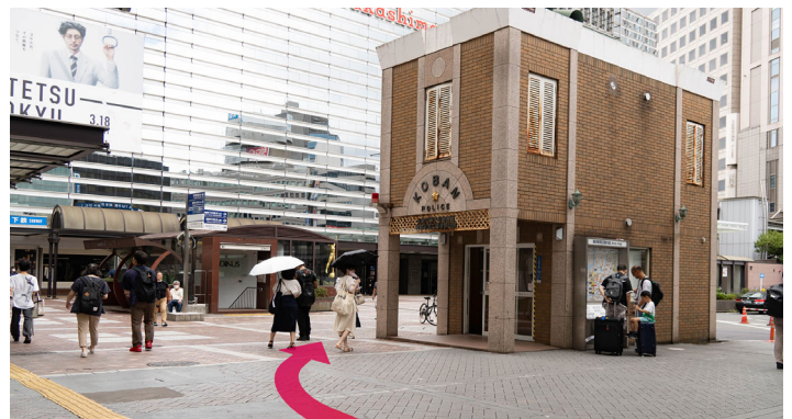
4 西口を出てすぐ左に交番がありますので、交番の前を過ぎて高島屋の方向に進みます。